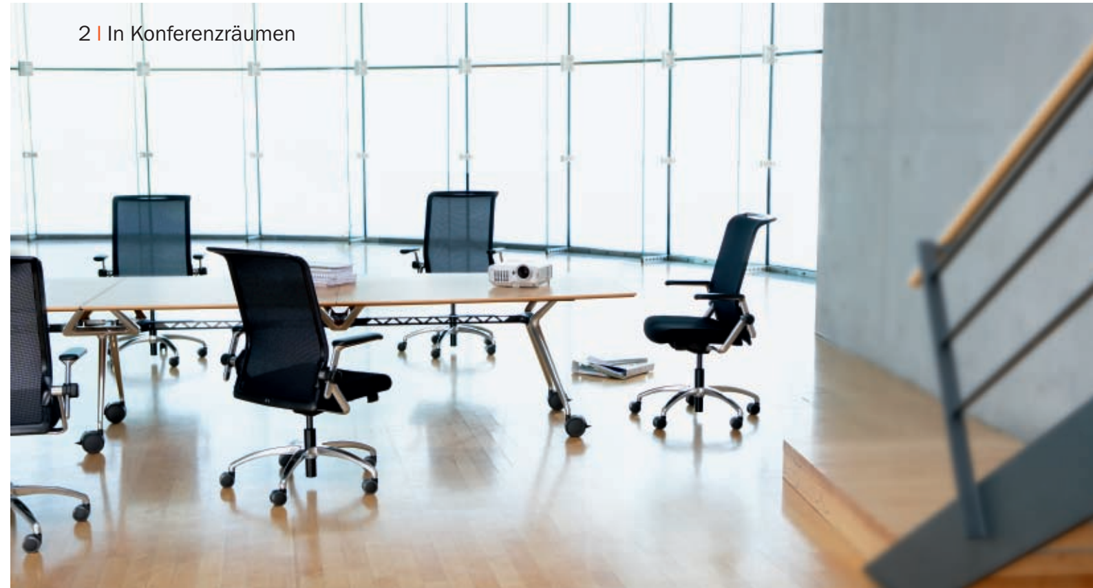
2 | In Konferenzräumen