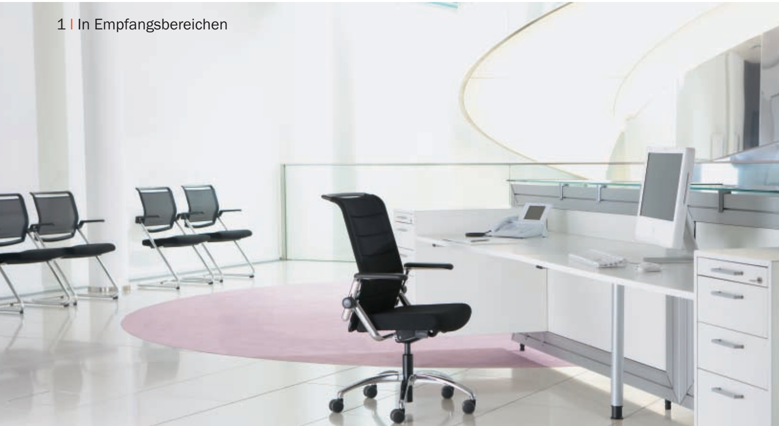
1 | In Empfangsbereichen