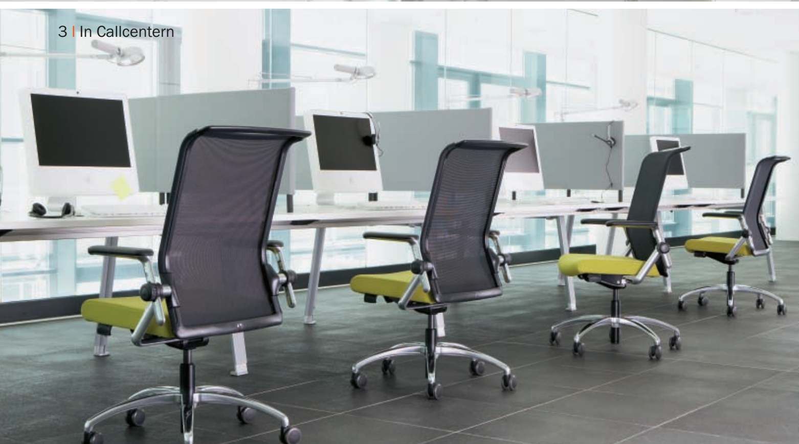
3 | In Callcentern